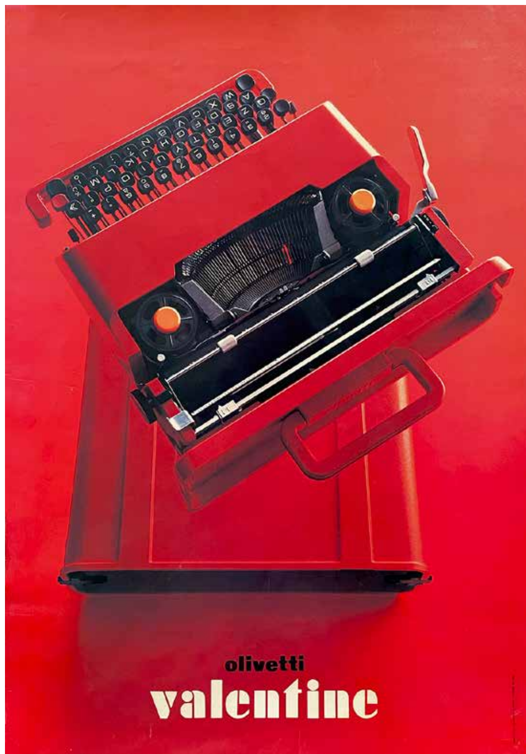
3. Olivetti Valentine , grafica di Walter Ballmer, stampato da Grafiche A. Nava, Milano, 1969.