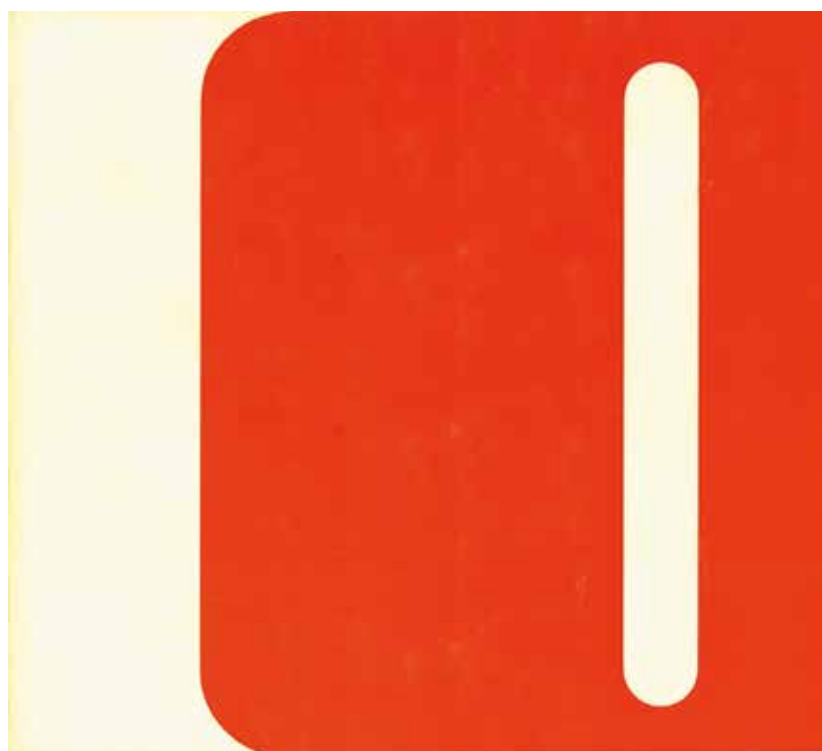
2. Stile Olivetti. Geschichte und Formen einer italienischen Industrie, grafica di Walter Ballmer, stampato da Regina-Druch, Zurigo, 1961.