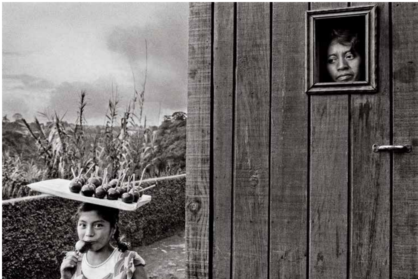
4. Sebastião Salgado, Periferia di Città del Guatemala , 1978. Collezione MEP, Parigi, Dono dell'autore 1988