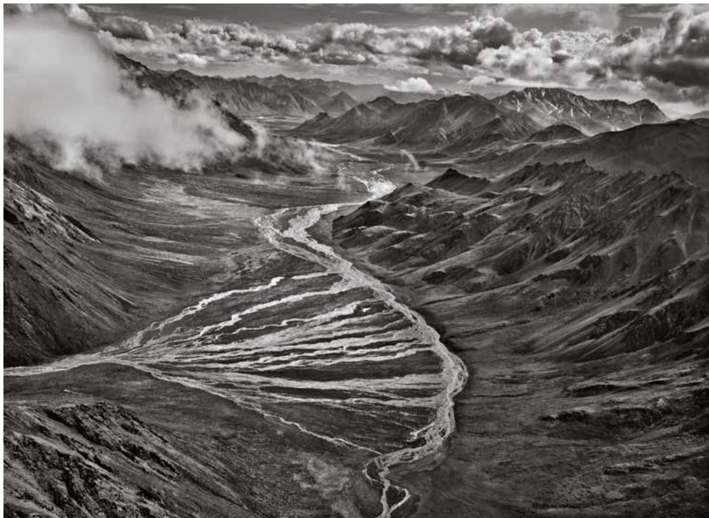
5. Sebastião Salgado, Monti Brooks, Arctic National Wildlife Refuge, Alaska, Stati Uniti , 2009. Collezione MEP, Parigi. Dono di Sebastião Salgado e Lélia Wanick Salgado 2018