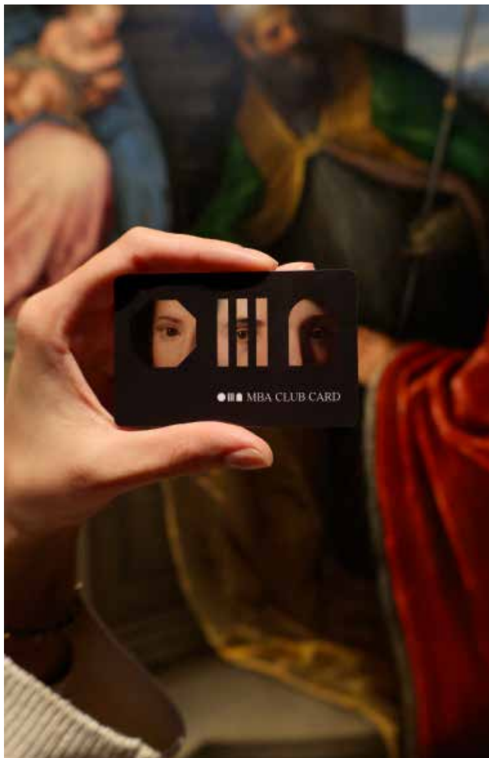
MBA Club Card © MBA Musei Biblioteca Archivio di Bassano del Grappa

DIMENTICA IL BIGLIETTO E TORNA IN MUSEO QUANTE VOLTE VUOI CON MBA CLUB CARD